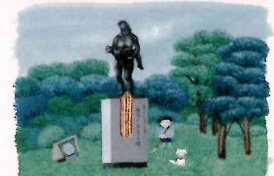
原爆犠牲国民学校教師と子どもの碑