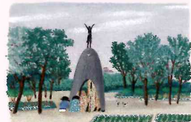
原爆の子の像(千羽鶴の塔)