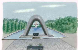
広島平和都市記念碑(原爆死没者慰霊碑)