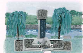
韓国人原爆犠牲者慰霊碑